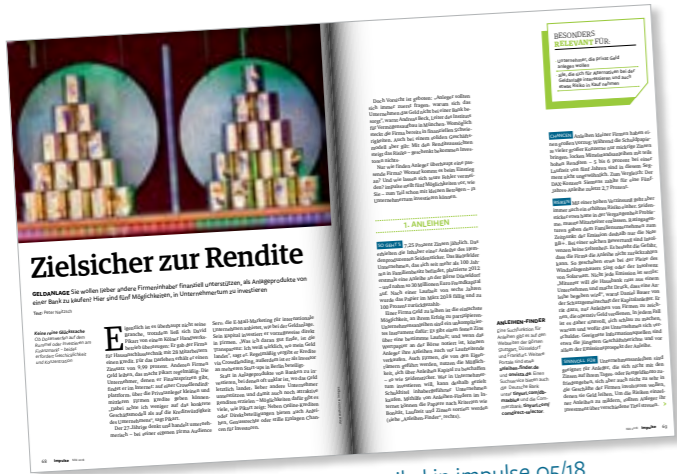
Das Extra zu unserem Geldanlage-Artikel in impulse 05/18